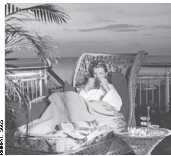
Genießen Sie ein paar entspannte Tage!

11.10.2009 – 22.12.2009 04.01.2010 – 25.03.2010 26.03.2010 – 30.04.2010* € 128,- (2 Übernachtungen) € 285,- (5 Übernachtungen) Preis p.P. im DZ