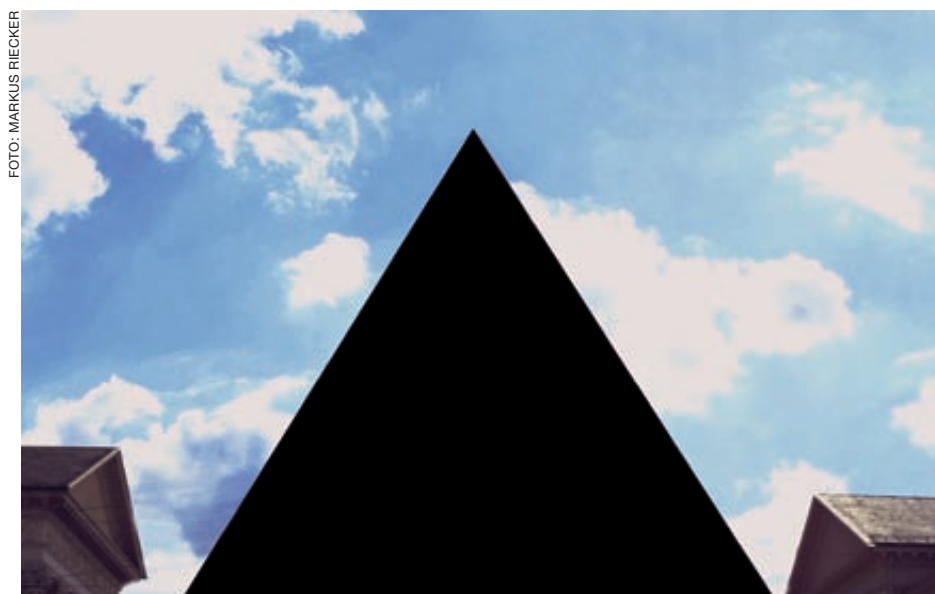
Weite Teile des Universums sind bis heute ein dunkles Rätsel.

Die zusätzliche Anziehungskraft kommt von der Dunklen Materie. Physiker rätseln bislang über ihre Natur. Sie nehmen an, dass sie aus verschiedenen Teilchenarten besteht, die nur sehr schwache Kräfte mit gewöhnlicher Materie austauschen. Deshalb ist Dunkle Materie auch unsichtbar. Eine dieser Teilchenarten sind die Neutrinos, die aber wegen ihrer winzigen Masse nur einen geringen Anteil an der Gesamtmasse der Dunklen Materie haben können. Dunkle Energie ist ein noch rätselhafteres Phänomen: Während Dunkle Materie mit gewöhnlicher Materie die anziehende Schwerkraft gemeinsam hat, hat Dunkle Energie eine abstoßende Schwerkraftwirkung und bläht das gesamte Universum immer schneller auf. Die Entfernungsmessung für bestimmte Supernovae, die immer gleich hell leuchten, hat dieses Phänomen bestätigt: Sie sind viel weiter von der Erde entfernt als es die anziehende Schwerkraft eigentlich erlauben würde. <cm>